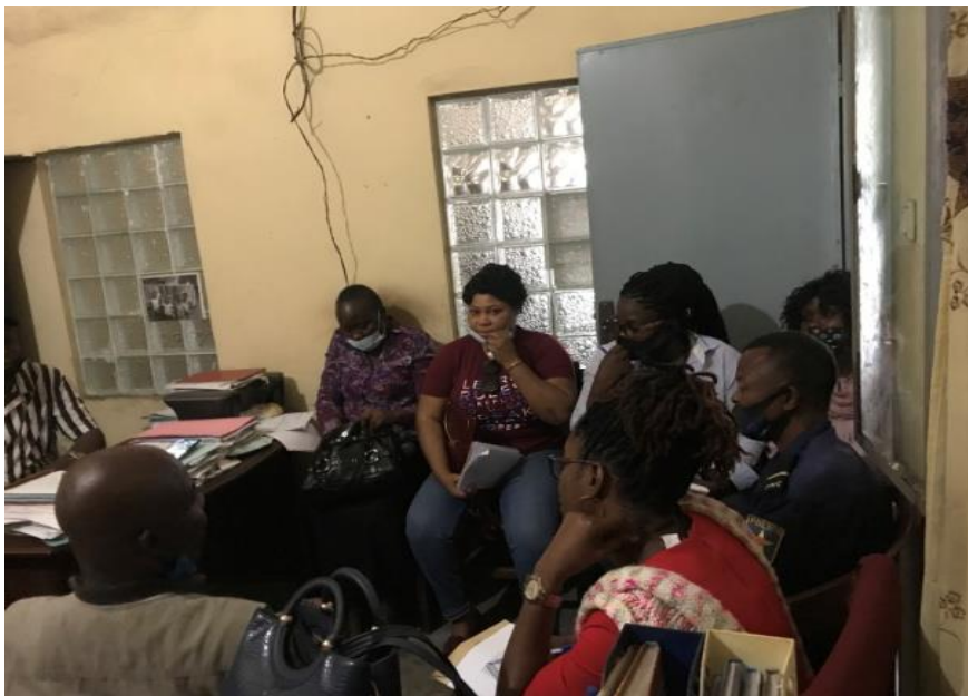
Communauté protectrice de Kasa- Vubu et l'équipe de REEJER

Au cours de ces échanges, il a été question pour l'équipe du REEJER de faire une brève présentation de la CPS, d'expliquer comment seront organisées les différentes sessions des CPS et solliciter l'engagement des membres des communautés protectrices dans le déroulement de cette approche. En outre, certaines communes ont promis d'envoyer les problèmes prioritaires rencontrés dans leurs communes qui feront objets de discussion des sessions CPS et d'autres comme Makala, Bandalungwa, Kasa-vubu et Kintambo ont relevé et partagé à l'équipe de REEJER quelques problèmes dont les enfants et toute la communauté sont victimes en autres: