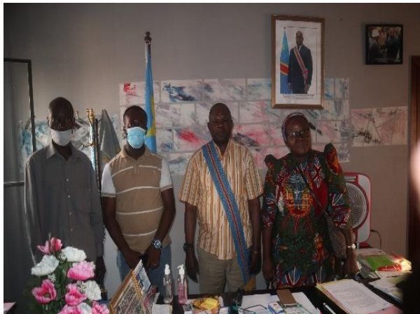
Le Bourgmestre de Ngaba et l'équipe du REEJER