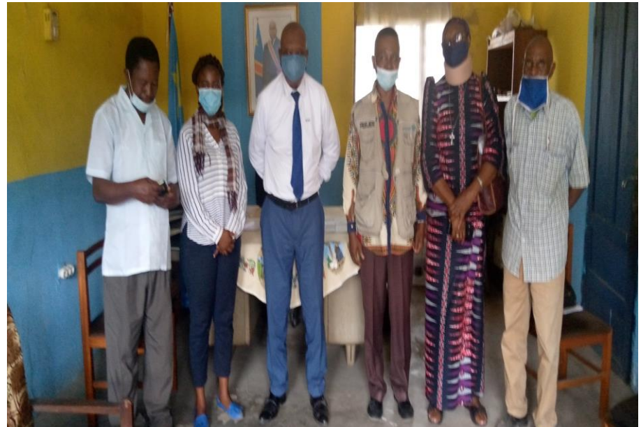
Le Bourgmestre de Kisenso et l'équipe du REEJER