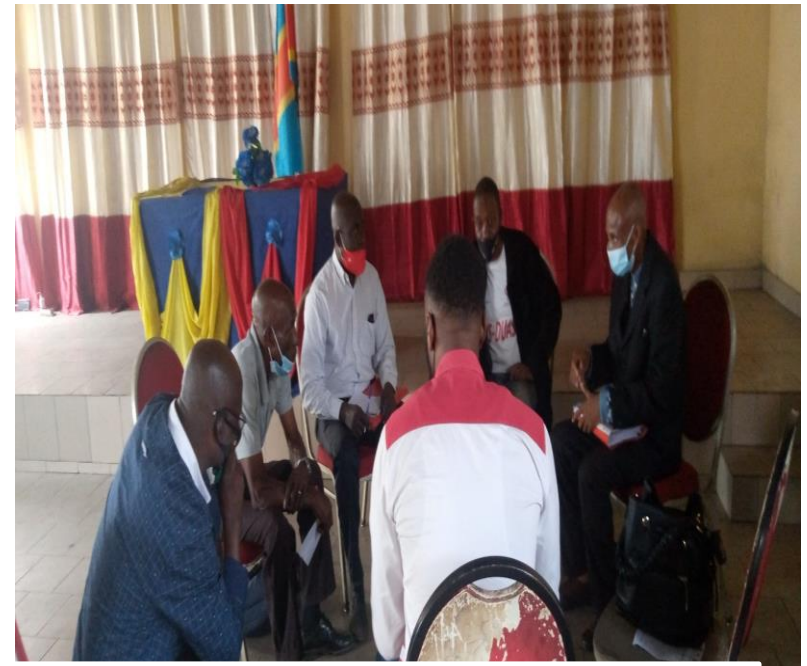
Communauté protectrice de Kimbanseke et l'équipe de REEJER