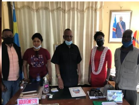
Le Bourgmestre de Makala et l'équipe du REEJER