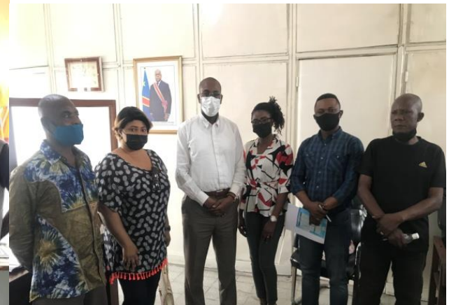
Le Bourgmestre de Bandalungwa et l'équipe du REEJER