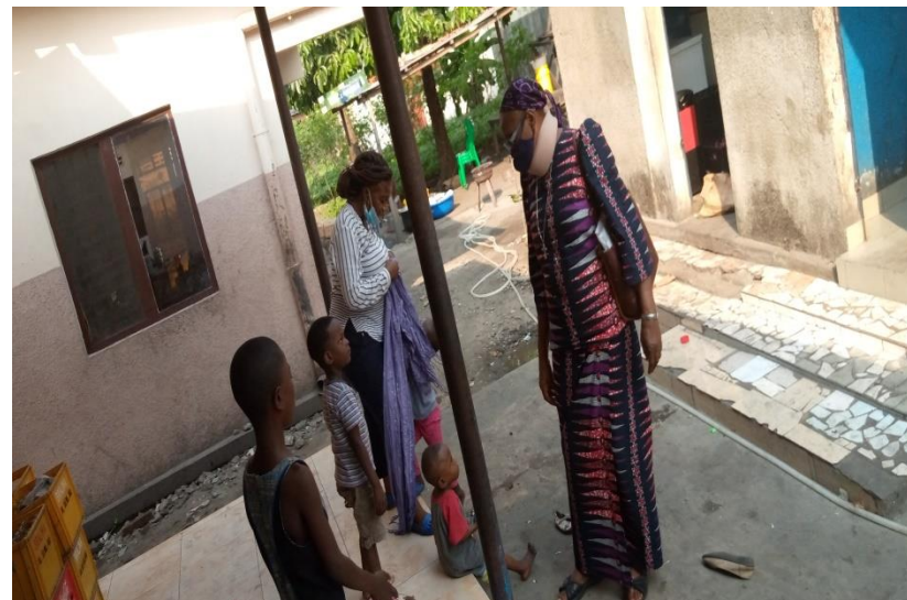
L'équipe de REEJER et les enfants accompagnés dans la structure VTA