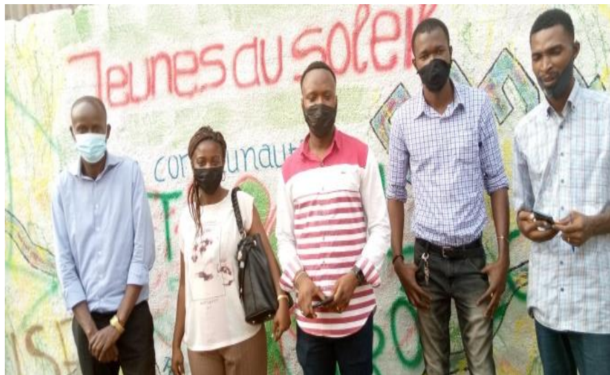
L'équipe de REEJER et les éducateurs de la structure jeunes au soleil (JOS)

Structures membres du REEJER ont été visité notamment OSEPER, LASAMARITAINE, Fondation secours d'Afrique, ONGCHED/maman sabina.